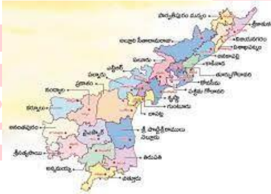
AP New districts