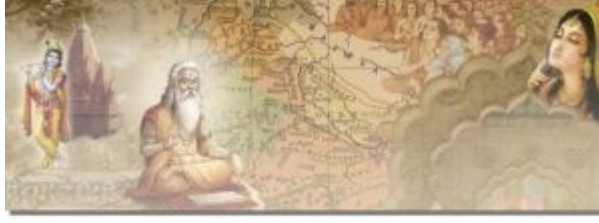
VEDIC CIVILIZATION ANCIENT INDIA (1500 BC-500 BC)